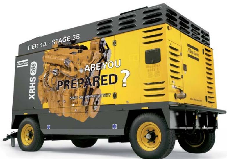
Atlas Copco on valmistautunut. Entä käyttäjät?

vesikaivojen ja erilaisten paalutusten poraukseen.