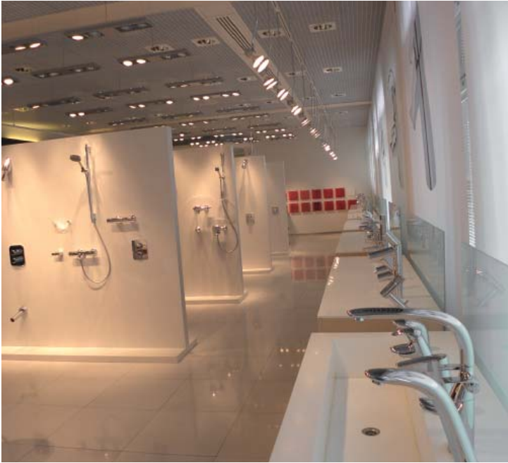
Kuva Oraksen näyttelytilasta.

Copcolla, jolloin Atlas Copco pitää myös huolen kompressoreiden kunnosta.